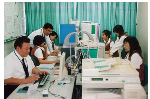
▲地域高齢福祉に貢献したい