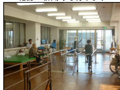
理学・作業療法士と個々に合った専門的なリハビリを