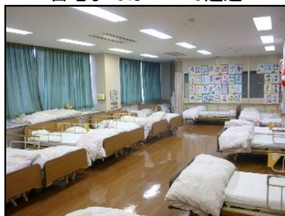
利用中に疲れたら仮眠スペースで休憩を