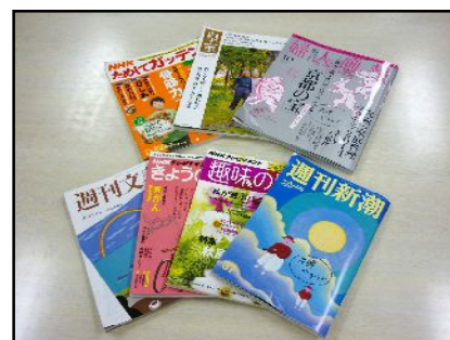
雑誌・新聞等もあります