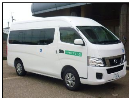
自宅まではバスで送迎