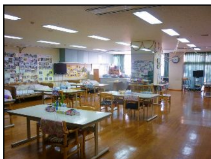
食事・談笑はダイニングで